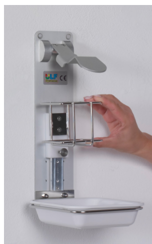
Abb. Links zeigen Korbwechsel, z.B. von 500 ml auf 1000 ml.

Handhabung: Untere Stellschraube nach links drehen und Korb mit Adapter rausziehen. Anderen Korb einsetzen und mit Stellschraube fixieren.