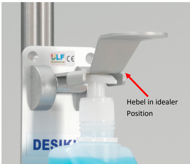
Abb. links zeigt Flasche mit richtig positioniertem Hebel.

Mit Ulf Systems Desipenser der Desikus Varios Serie haben Sie keinen Aufwand bezüglich Aufbereitung. Die offene Architektur begünstigt die Verwendung unterschiedlichster Fabrikate als auch Dispenser. Der Zeitaufwand bei Wechsel von verschiedenen Fabrikaten beträgt nur Sekunden. Zudem kann jedes Teil bei Bedarf ersetzt werden.